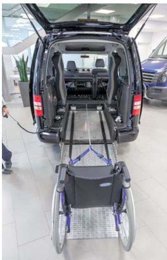
Uutta Carsportilta: "vinssi" jolla tuoli hinataan luiskaa pitkin autoon.

Kiertueella olivat mukana huippuvarusteltu ja edullinen VW Transporter PRO, tilaihme VW Crafter PRO kattavalla varustelulla ja uudistunut, Suomen suosituin esteetön matalalattiataksi VW Caddy.