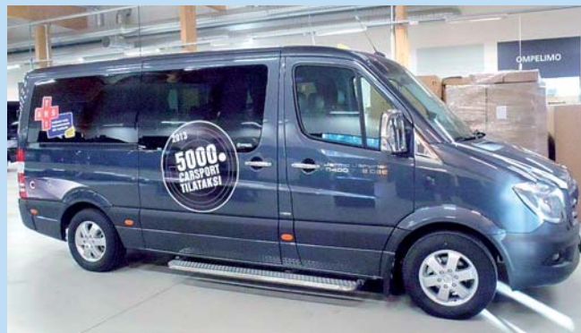
Monikäyttöiseksi tilataksiksi varusteltu Mercedes-Benz Sprinter -juhlamalli.

Veho Hyötyajoneuvojen johtaja Juha Ruotsalainen kertoi, että Carsportin kanssa yhteistyössä tuotiin ensimmäinen Mer-