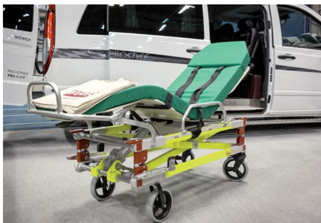
Pensi Rescue Oy:n Parensi siirtokuljetuspareilla potilaan kuljetus onnistuu turvallisesti ja tehokkaasti myös yhden käyttäjän voimin. Taustalla Prostyle Erikoisajoneuvojen Mercedes.