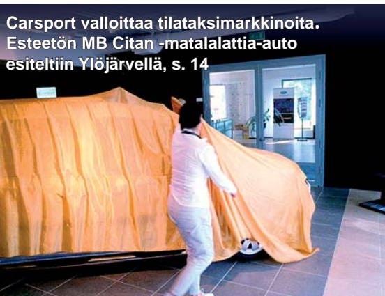
Carsport valloittaa tilataksimarkkinoita. Esteetön MB Citan -matalalattia-auto esiteltiin Ylöjärvellä, s. 14