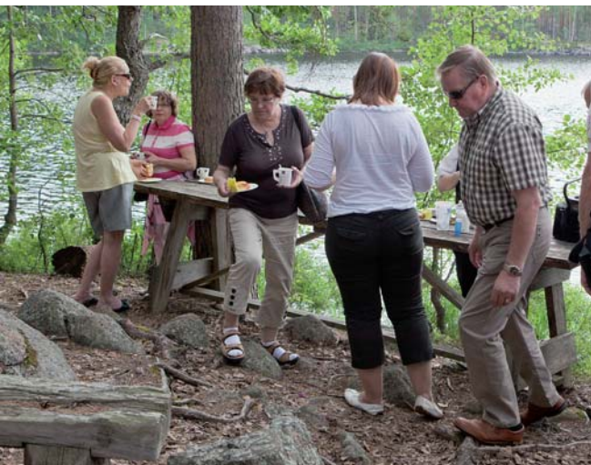
Nokipannukaffetit Löppösen luolalla.