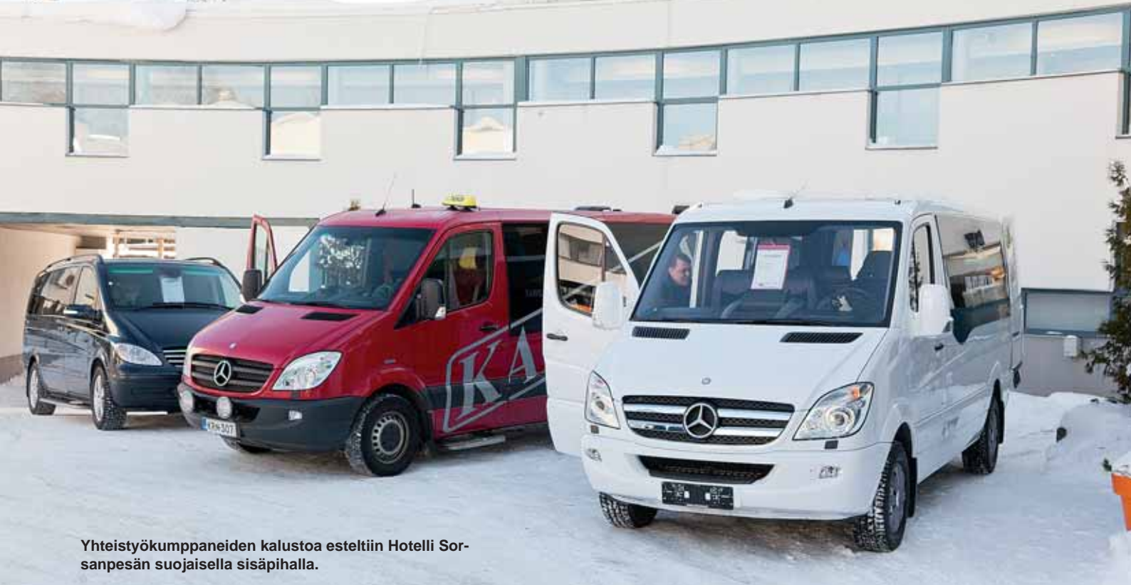
Yhteistyökumppaneiden kalustoa eseltiin Hotelli Sor-sanpesän suojaisella sisäpihalla.