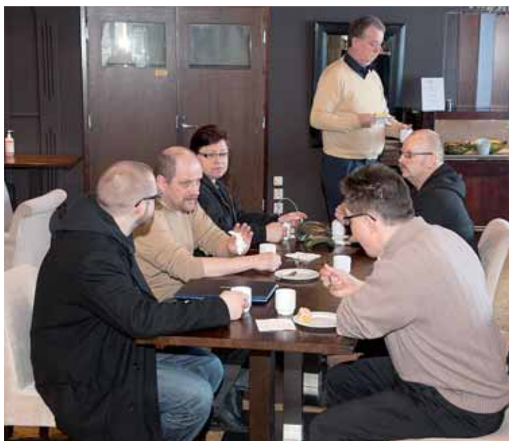
Keskustelu jatkuu kahvipöydässä. Kokouksissa eri puolilta Suomea tulevat jäsenet pääsevät vaihtamaan kokemuksia ja kertomaan kokemuksia. Pöydässä edustettuna Joensuu, Vaasa, Savonlinna ja Tampere.