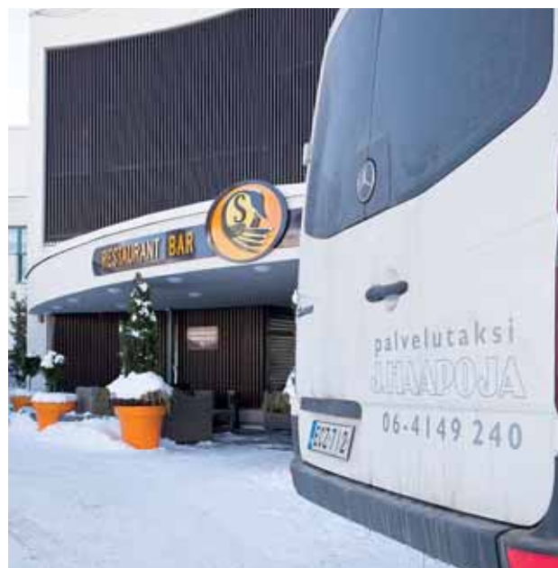
Hotelli Sorsanpesä puheenjohtaja Haapojan kotikulmilla Seinäjoella, tarjosi kokoukselle miellyttävät puitteet.