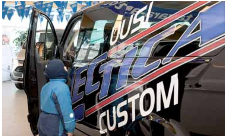
Pienet ja vähän isommatkin miehet olivat kiinnostuneita Customin henkilöautomaisesta ohjaamosta.